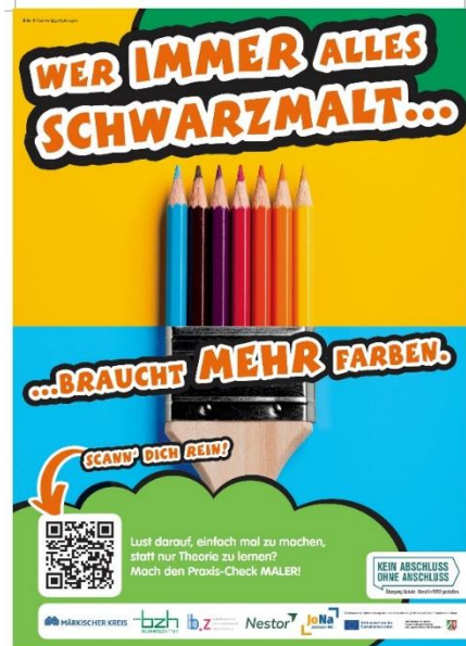
Plakat Praxis-Check, Screenshot: KAoA/MK

In der Werkstatt Maler dürfen die Schülerinnen und Schüler als Gemeinschaftsprojekt ein Wandtattoo entwickeln. Hierzu gibt es Einblicke in die Farblehre, in Auftragungstechniken und die Untergrundbearbeitung.