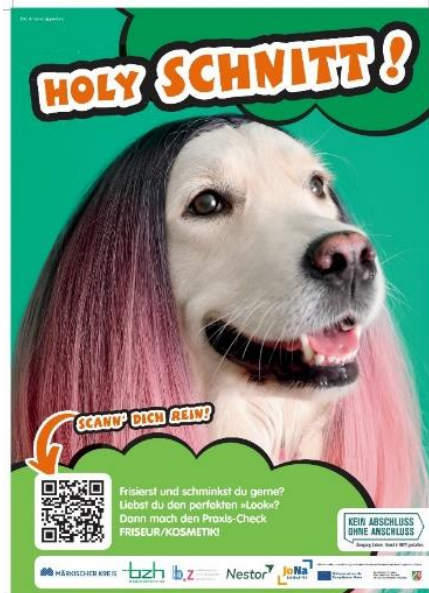
Plakat Praxis-Check, Screenshot: KAoA/MK

Im Speziellen lernen die Schülerinnen und Schüler die Aufgaben der Friseurin/des Friseurs kennen. Sie erfahren die Basics des Kundengesprächs, der Haut- und Haardagnostik sowie der Typberatung. Die Jugendlichen dürfen sich sowohl im Hochstecken von Haaren als auch in der Handmassage üben. Ebenfalls können Nageldesigns und Make-ups ausgedacht oder entwickelt sowie anschließend umgesetzt werden. Als Projekt steht das Styling für einen von den Schülerinnen und Schülern ausgewählten Anlass im Mittelpunkt.