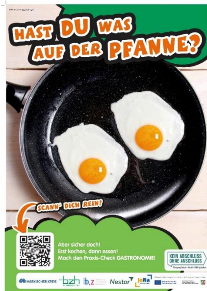
Plakat Praxis-Check, Screenshot: KAoA/MK