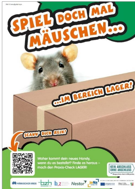
Plakat Praxis-Check

Waren bewegen ist in einer globalisierten Welt wichtiger denn je. Doch wie bestelle ich in diesem Moment ein Produkt im Internet und morgen kommt das Paket bei mir unbeschadet an. In dem Praxiskurs Lagerlogistik lernen die Schülerinnen und Schüler die Abläufe des Wareneingangs, der Kommissionierung, den innerbetrieblichen Transport bis hin zum Versand kennen. Spielerisch werden Routen geplant und kleine Aufgaben mit dem Hubwagen absolviert.