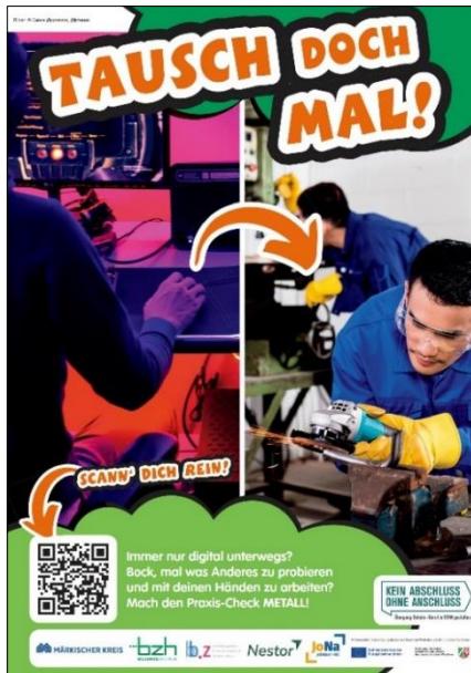
Plakat Praxis-Check, Screenshot: KAOA/MK