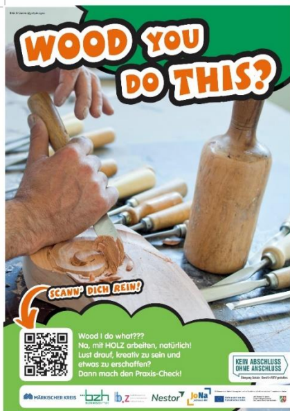
Plakat Praxis-Check, Screenshot: KAoA/MK

Die Schülerinnen und Schüler erstellen selbstständig das Werkstück Teufelsknoten.