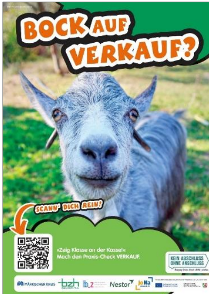
Plakat Praxis-Check, Screenshot: KAoA/MK