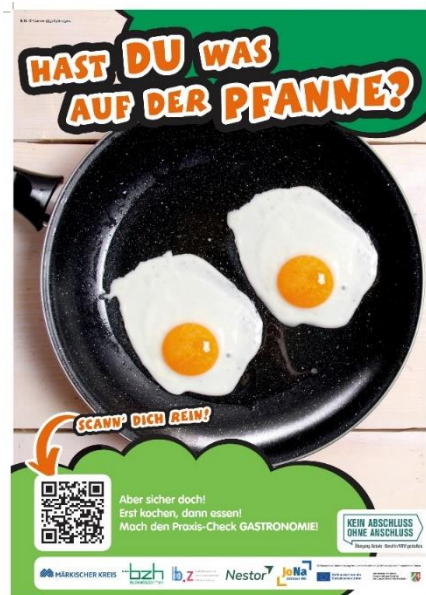
Plakat Praxis-Check, Screenshot: KAoA/MK

Durch das Anbieten diverser Speisen in Form von Fingerfood wird die Möglichkeit geboten, die verschiedensten Techniken der Zubereitung und Garmethoden kennenzulernen. Dabei wird u.a. auch auf die unterschiedlichen Ernährungsformen (z.B. vegan, vegetarisch) eingegangen. Zusätzlich kommen die Schülerinnen und Schüler in diesem Praxiskurs mit der Warenkontrolle und Kalkulation durch die Speisenplanung sowie den Einkauf in Kontakt. Des Weiteren werden Themen wie Hygiene am Arbeitsplatz und auch der Servicebereich behandelt.